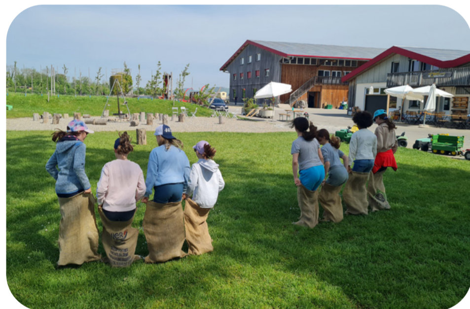
Momentaufnahme im Sommerlager 2024